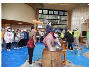
令和元年度 もちつき体験学習