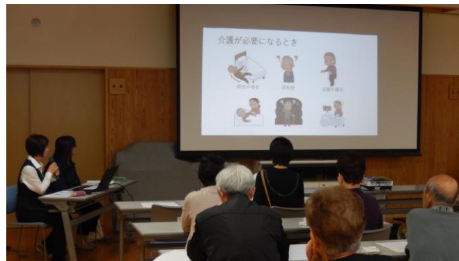
令和元年度 出張介護教室

高齢者と共に楽しく過ごせる環境づくりを目指していきたいと思っておりますので、皆様ご協力を宜しくお願いします。