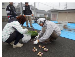
令和元年度 花いっぱい運動