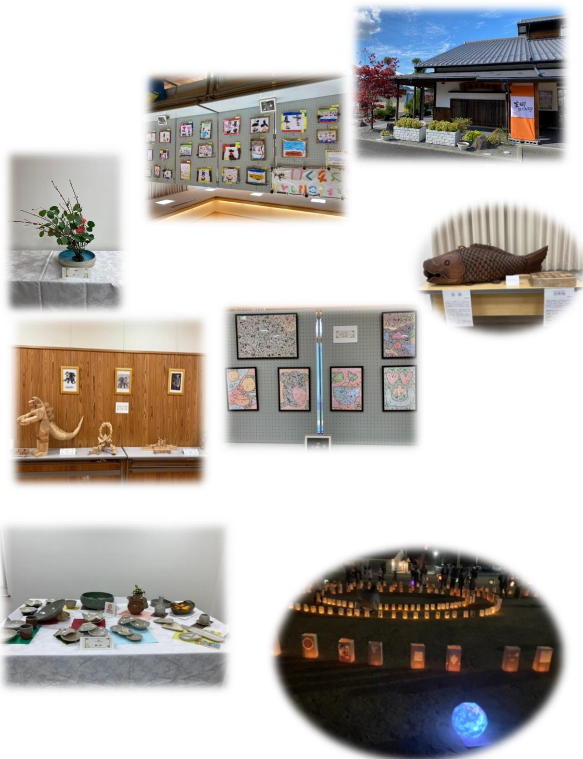
まちの灯りフェスティバル in 東小学校